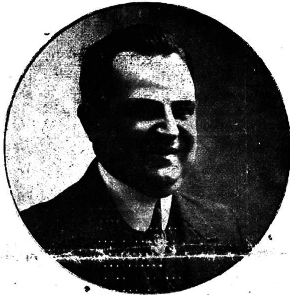
M. LUCIEN SUIRE Grand premier comique

Un simple coup d'œil suffit — a-t-il déclaré — à gauche pour les violons, à droite pour les autres instruments. Il en est de même pour les chanteurs ; mainte actrice — disent les mauvaises langues — l'interroge... sans nécessité... du regard... afin que le maestro puisse... tout en faisant de l'œil à la cantatrice, lui donner la juste mesure !