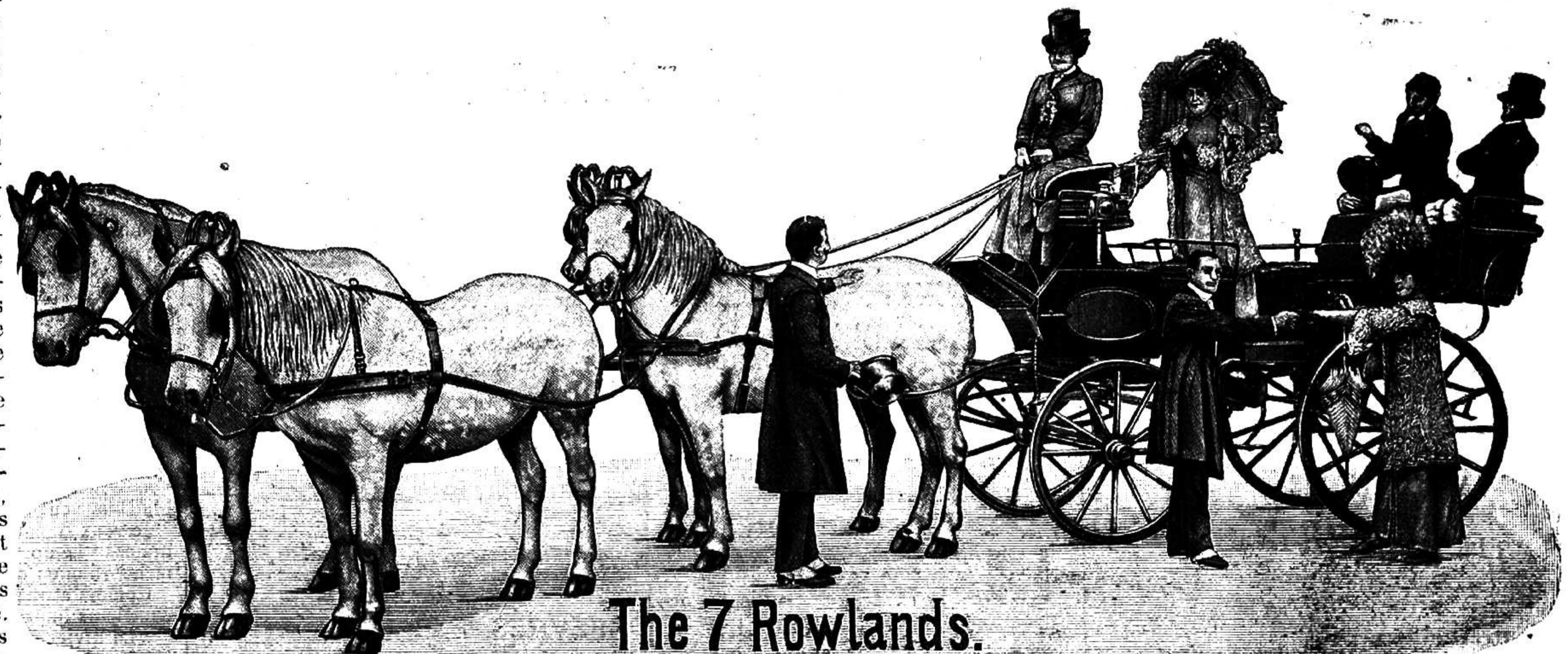
The 7 Rowlands.

LES MEILLEURS VINS SE TROUVENT « AUX CAVES DE FRANCE » 15, RUE DES BASSINS - DUNKERQUE